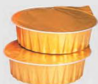
Pâte à brûler Réf. 1090