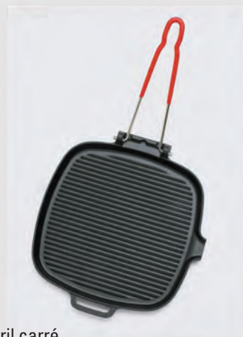
Gril carré Manche fil rabattable