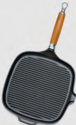
Gril carré Manche bois