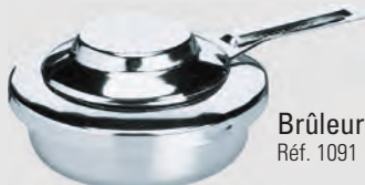
Brûleur pâte ou alcool Réf. 1091