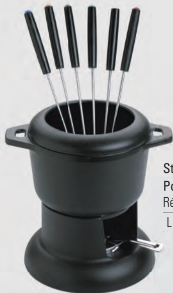
Standard Pot ø 14 cm Réf. 1003