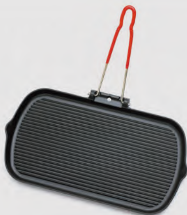
Gril rectangle Manche fil rabattable