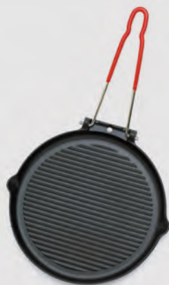
Gril rond Manche fil rabattable