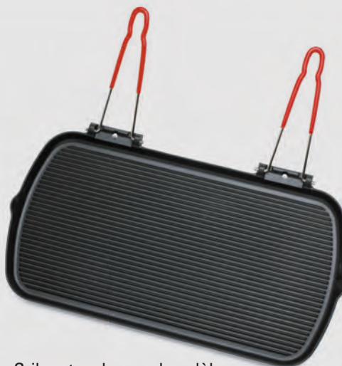
Gril rectangle grand modèle Double poignée