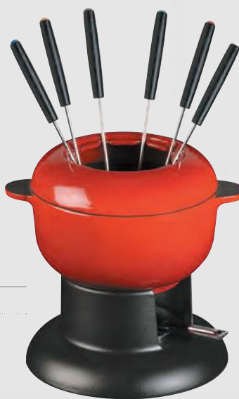
Brunch Pot ø 16 cm Réf. 1014